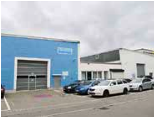
Die Produktionshalle der Sandvik SPS GmbH im Schmidener Industriegebiet

Dunkelstrahlerheizungen arbeiten nach dem Prinzip der Sonne. Die Stadtwerke Fellbach setzen das kluge Heizsystem in ihrem Dienstleistungsangebot Wärme-Direkt-Service um.