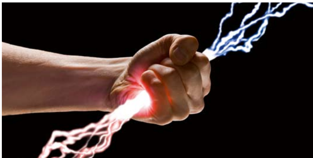
Am Strommarkt wird hart um Kunden gekämpft. Die Stadtwerke Fellbach können am Markt überzeugen.

www.stadtwerke-fellbach.de , unter der Rubrik Unternehmen